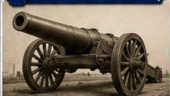
Dělostřelecká výzbroj patřila k významným výrobkům závodů.