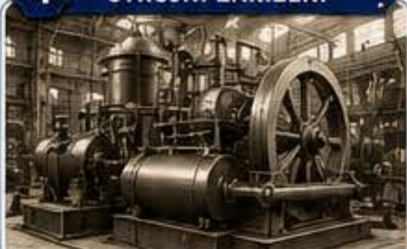
Stroje pro cukrovary, pivovary a další průmyslové podniky.