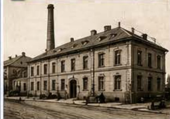
Plzeňská strojírna, kterou koupil Emil Škoda v roce 1869.