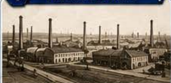
Pohled na areál Škodových závodů na konci 19. století.