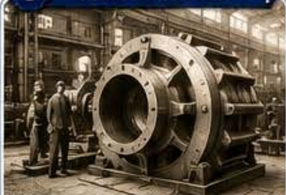
Velké ocelové odlitky vyráběné v Škodových závodech.